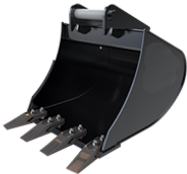
Tieflöffel mit Zähnen